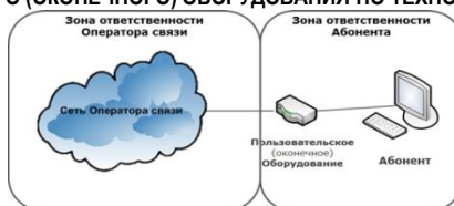
СХЕМА ВКЛЮЧЕНИЯ ПОЛЬЗОВАТЕЛЬСКОГО (ОКОНЕЧНОГО) ОБОРУДОВАНИЯ ПО ТЕХНОЛОГИИ xPON